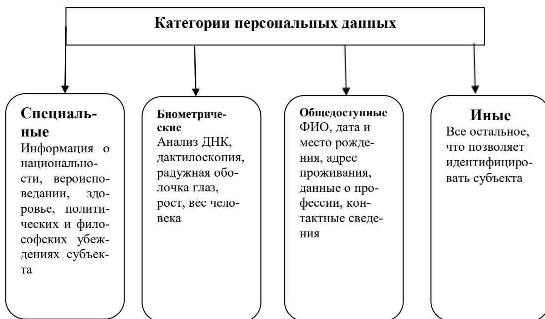
Рис. 1. Категории персональных данных

В Российской Федерации также существуют определенные правила и нормы, которые регулируют конфиденциальность персональных данных. Одним из таких законов является Федеральный закон №152-ФЗ "О персональных данных". Нарушение этих норм может повлечь за собой наложение штрафов, административную ответственность, а в некоторых случаях даже возбуждение уголовного дела. Кроме того, нарушение процедур обработки персональных данных может привести к потере деловой репутации и утечке клиентов. В связи с этим, соблюдение требований, установленных Федеральным законом № 152-ФЗ и другими нормами, регулирующими область персональных данных, является важным аспектом для любой компании, которая работает с персональными данными, независимо от того, являются ли они непосредственными операторами персональных данных или осуществляют обработку данных от имени оператора.